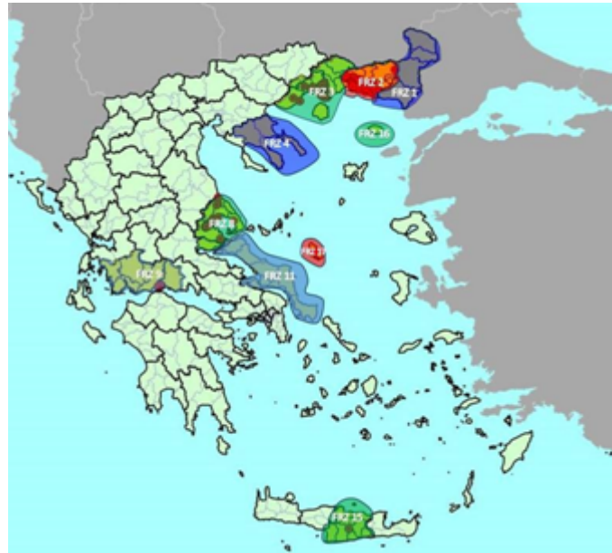
Εικόνα 2. Περαιτέρω Απαγορευμένες Ζώνες όπως ορίζονται στο Παράρτημα, Μέρος Β.

Κατόπιν διαβούλευσης με τις αρμόδιες υπηρεσίες της Ευρωπαϊκής Επιτροπής, πρόκειται να ενσωματωθούν στο Παράρτημα της Εκτελεστικής Απόφασης (ΕΕ), αναφορικά με ορισμένα μέτρα έκτακτης ανάγκης σχετικά με την ευλογία των αιγοπροβάτων και οριοθετούνται οι παρακάτω ζώνες στις Π.Ε. Έβρου, Ροδόπης, Ξάνθης, Καβάλας, Δράμας, Χαλκιδικής, Μαγνησίας και Σποράδων, Φθιώτιδας, Φωκίδας, Αιτωλοακαρνανίας, Εύβοιας, Ηρακλείου στη Μοναστική Πολιτεία του Αγίου όρους, στον Δήμο Σαμοθράκης και στον Δήμο Σκύρου ως ακολούθως (Εικόνα 2):